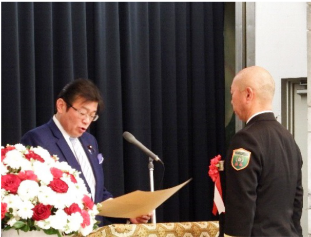
表彰状の授与（大塚国土交通副大臣より）