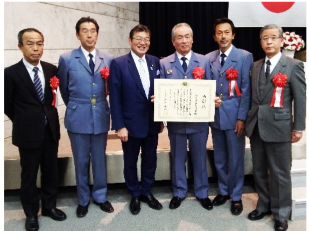
表彰式後、大塚国土交通副大臣と受賞者の方で記念撮影