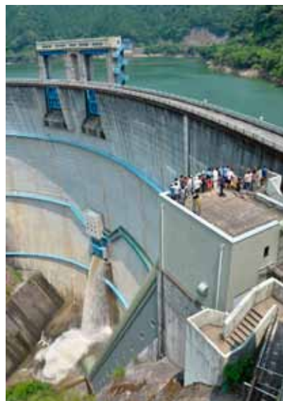
コンジットゲート放流管放水実演の様子