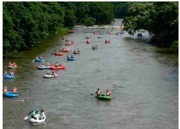
ゴムボート川下りの状況