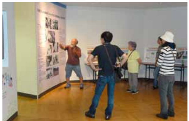
貴重種保護活動の説明