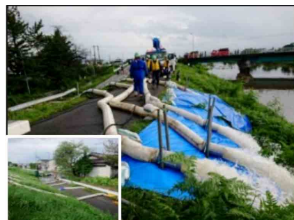
排水ポンプ車による浸水排除（青森県弘前市）

7月、8月の大雨、台風第14号、第15号に対しては、被災自治体にTEC-FORCEを派遣し、排水ポンプ車による浸水排除や道路、河川等の被災状況調査等を実施した。特に8月の大雨においては、北海道、東北、関東、北陸、中部、近畿、中国、九州地方の1道19県28市町村へ、延べ1,400人を超えるTEC-FORCEを派遣し、被災地の早期復旧に貢献した。また、台風第15号では、断水被害に対し、給水機能付き散水車の貸出などの広域応援を実施した。