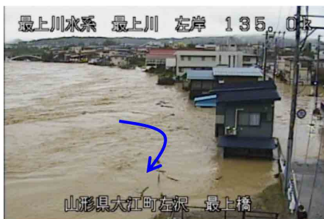
最上川水系最上川の浸水状況(山形県大江町)

このほか、JR東日本・米坂線の橋梁倒壊(山形県飯豊町)やJR東日本・五能線の橋梁傾斜(青森県鰺ヶ沢町)等5事業者11路線で鉄道の施設被害が発生した。