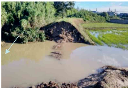
矢作川水系広田川の堤防決壊（愛知県幸田町）

この大雨により、太田川水系敷地川や矢作川水系広田川で堤防が決壊するなど、県が管理する16水系28河川で氾濫が発生し、静岡県などで181件の土砂災害が発生した。また、高速道路1路線1区間、直轄国道1路線3区間、県が管理する道路40区間で被災による通行止めが生じたほか、3事業者4路線で鉄道の施設被害が発生した。このほか、静岡市等で大規模な断水や停電が発生するなどライフラインにも大きな被害が生じた。