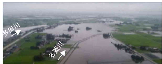
鳴瀬川水系名蓋川の浸水（宮城県大崎市・加美町）

この大雨により九州から東北の各地で、河川氾濫等や土砂災害による被害が発生した。鳴瀬川水系名蓋川や北上川水系出来川等で堤防が決壊するなど県管理河川において11水系28河川で、河川からの氾濫等の被害が発生した。また、14府県で45件の土砂災害が発生した。このほか、宮城県大崎市の市道で丸山橋が落橋するなどの被害が発生した。