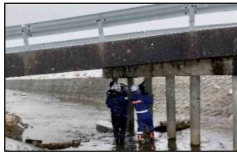
橋脚の被災状況調査（福島県相馬市）

福島沖を震源とする地震に対し、6県11市町へのTEC-FORCE派遣、防災ヘリコプター3機による広域調査、断水となった地域への散水車による給水支援、道路、港湾、公共建築物の被災状況調査等を実施した。また、石川県能登地方を震源とする地震の際には、石川県及び珠州市にリエゾンを派遣し関係自治体との連絡体制を確保しつつ、防災ヘリやTEC-FORCE等による被災状況調査を実施した。