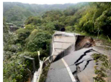
国道327号 道路損壊(宮崎県諸塚村)

この大雨の影響で、四国や九州地方等の国管理河川と県管理河川合わせて16水系29河川で氾濫が発生し、九州地方を中心に111件の土砂災害が発生した。また、宮崎県諸塚村の国道327号における道路損壊など高速道路5路線5区間、直轄国道5路線7区間、府及び県が管理する道路178区間で被災により通行止めとなった。このほか、鉄道については、JR九州・日南線の路盤流出(鹿児島県志布志市)など2事業者8路線で施設被害が発生した。