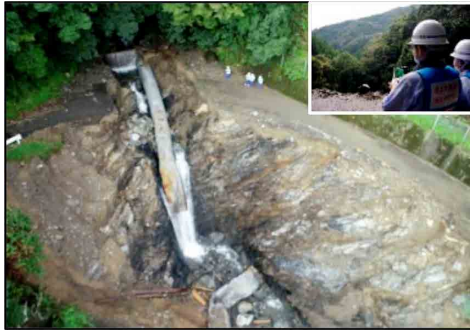
ドローンによる被災状況調査（宮崎県諸塚村）