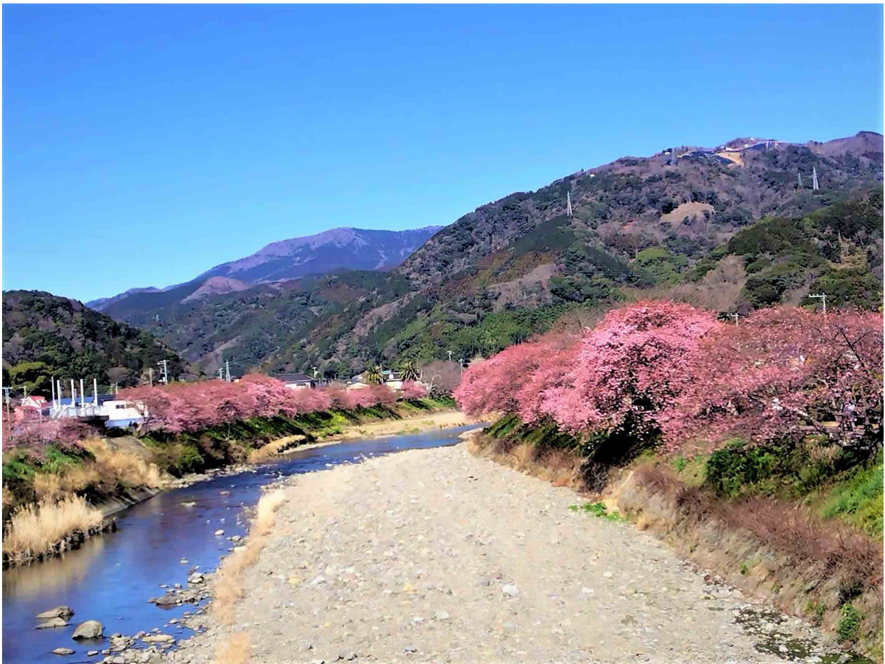
早春の河津川 (令和5年2月16日) 二級水系 河津川 (静岡県賀茂郡河津町)

東京都千代田区麹町4丁目8番26号 ロイクラトン麹町 電話 03(3222)6663 FAX 03(3222)6664 ホームページ https://zensuiren.org/ お問い合わせ info@zensuiren.org 編集・発行 椿本和幸