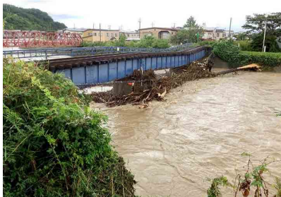
JR 東日本・五能線 橋梁傾斜(青森県鰺ヶ沢町)