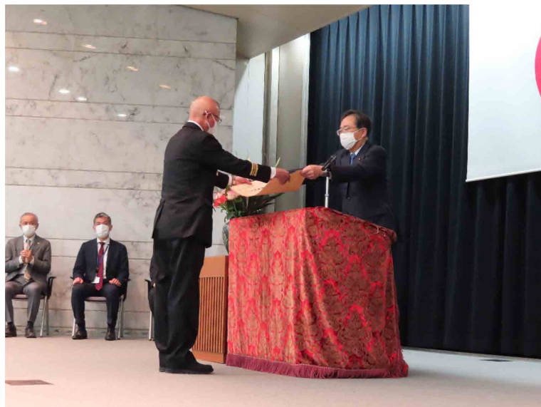
表彰状の授与(齊藤国土交通大臣より)