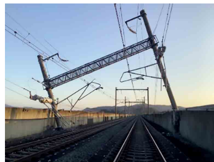
東北新幹線の電柱傾斜（福島～白石蔵王間）

た。この地震により、死者4名、負傷者247名の人的被害があった。福島・白石蔵王間での東北新幹線の脱線や電柱の傾斜等により運転見合わせとなったほか、常磐自動車道など高速道路12路線で通行止めが発生するなど、交通にも大きな影響をもたらした。