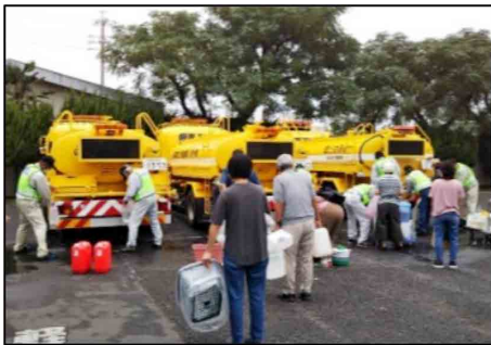
給水活動支援（静岡県静岡市）