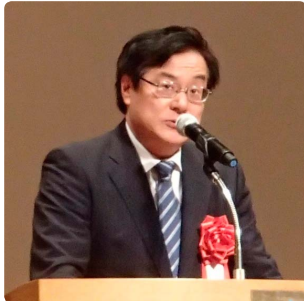
中部地方整備局長 八鍬 隆