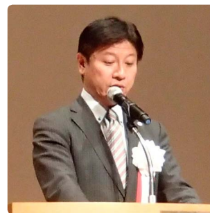
静岡県河川協会会長 (静岡市長) 田辺 信宏

皆さんこんにちは。今年度、河川協会会長を務めております静岡市長の田辺と申します。主催者の 1 人として、私からも一言ご挨拶申し上げますが、もうお二方から丁寧なご挨拶がありました。遠路はるばる、きょうはお集まりを賜りまして、どうもありがとうございます。また本日、ご多忙にもかかわらず、来賓の皆様にはご出席を賜りましたこと、厚く御礼を申し上げます。ありがとうございます。