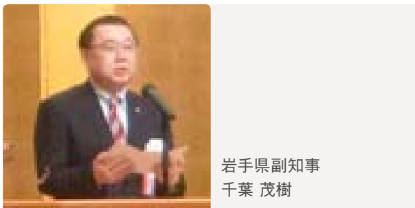
岩手県副知事 千葉 茂樹