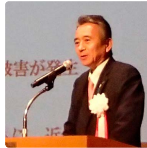
静岡県河川協会副会長 (浜松市長) 鈴木 康友