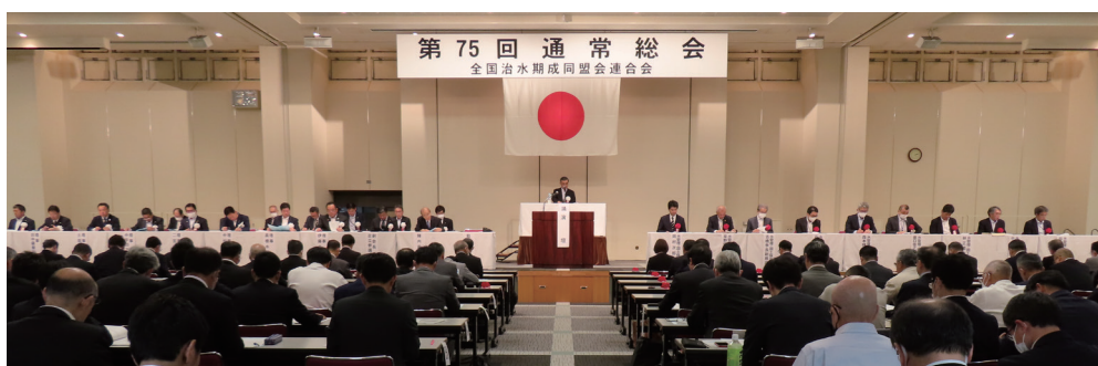
第75回全国治水期成同盟会連合会 通常総会