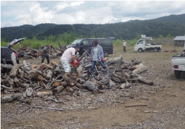
「流木配布」 夕張シューパロダム：北海道夕張市