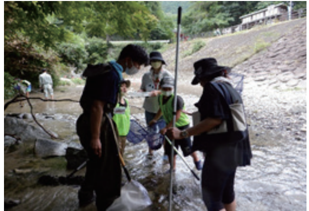
「自然と遊ぼうDAY！」（水生生物調査） 石手川ダム：愛媛県松山市