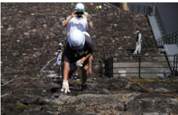
「ダム堤体登山」 御所ダム：岩手県盛岡市