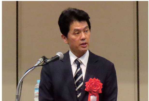
来賓挨拶 岡村 次郎 水管理・国土保全局長