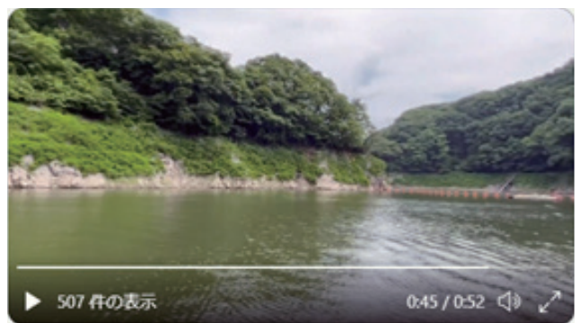
「YouTube等WEB活用」（バーチャルダム見学） 大門ダム：山梨県北杜市、塩川ダム：山梨県北杜市、菌原ダム：群馬県沼田市