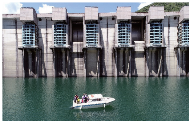
「長島ダム森と湖に親しむ旬間 2022」（湖面巡視体験） 長島ダム：静岡県榛原郡川根本町