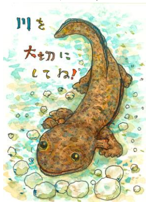
愛知県 山中 伸浩