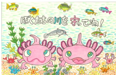
愛知県 山中 祐輝