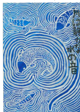
愛知県 三河 秀人