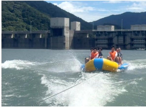
「水祭 SUISAI ～森と湖に親しむ旬間～」 ダム湖でのバナナボート 嘉瀬川ダム：佐賀県佐賀市