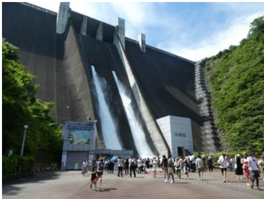
「宮ヶ瀬ダムフェア」 放流状況 宮ヶ瀬ダム：神奈川県愛甲郡