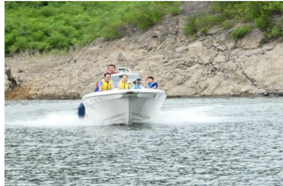
「月山ダムの集い」 湖面巡視体験 月山ダム：山形県鶴岡市