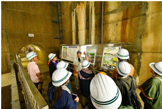
「かなやま湖湖水まつり」 ダム見学会 金山ダム：北海道空知郡