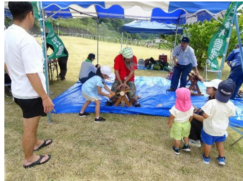
「茂庭っ湖まつり」 木工工作体験 摺上川ダム：福島県福島市