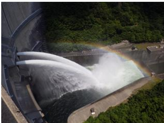
中位標高放流設備からの放流 温井ダム：広島県山県郡