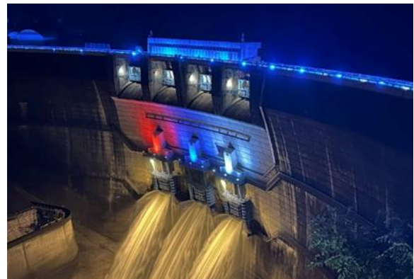
ダムライトアップ&放流状況 天ヶ瀬ダム：京都府宇治市