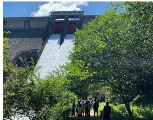
「引原ダム研究ツアー」 自由研究は「ダム」でどう？ 放流状況 引原ダム：兵庫県粟粟市