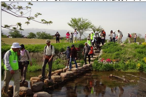
「かわ」と「まち」をつなぐフットパスルートの創出を河川管理施設の整備により支援