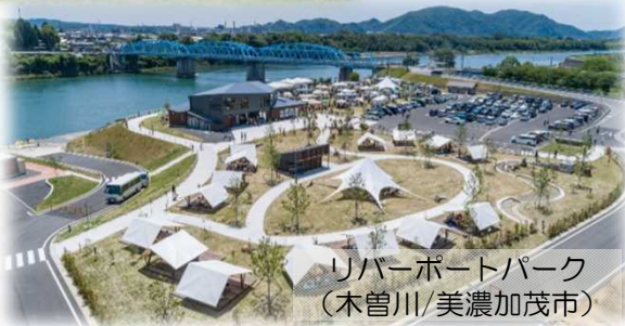
リバーポートパーク (木曽川/美濃加茂市)