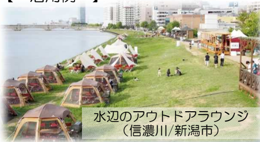
水辺のアウトドアラウンジ (信濃川/新潟市)