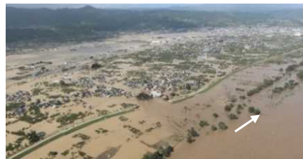
長野市穂保地先の堤防決壊、浸水被害状況

■ソフト施策 ・「まちづくり」や住まい方の誘導による水害に強い地域づくりの検討 ・高床式住まいの推進 ・マイ・タイムラインの普及 ・公共交通機関との洪水情報の共有 ・住民への情報伝達手段の強化