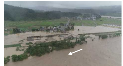
新潟県小千谷市内における浸水被害状況