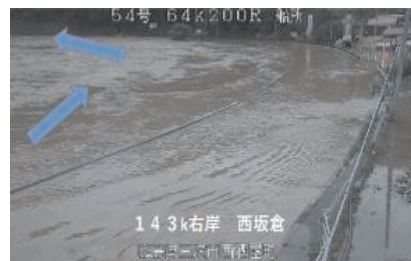
江の川の溢水状況（広島県三次市）