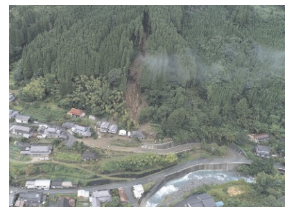
がけ崩れの状況（福岡県八女市）