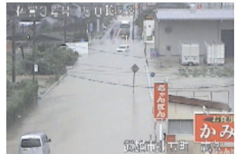
六角川の浸水状況（佐賀県武雄市）

※2 死者数は、「令和3年8月11日からの大雨による被害及び消防機関等の対応状況（第25報）」（消防庁作成）の数値を使用しており、風害等によるものを含む数値である。